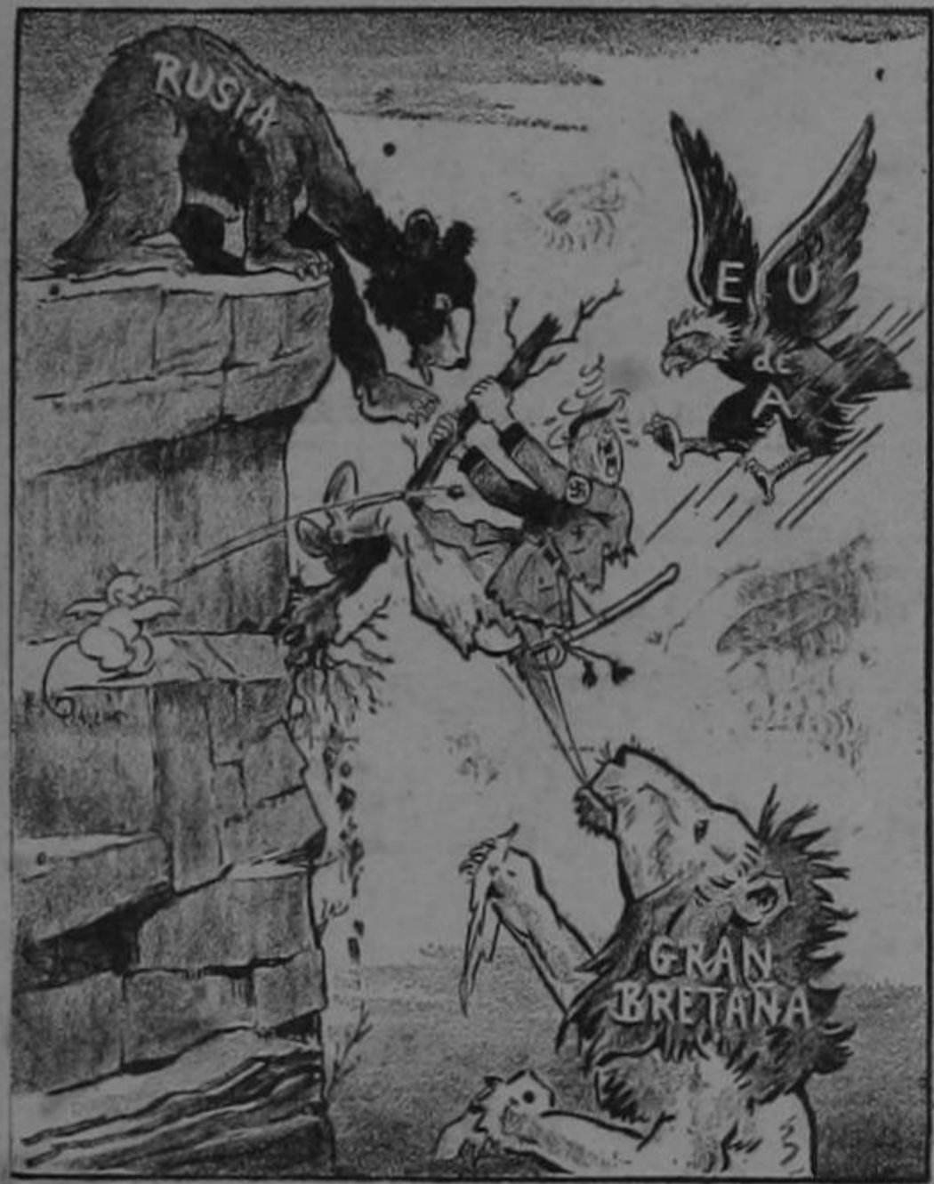
EL CAZADOR CAZADO

¡Y don León que se empeña en que su gente celebre una reunión en fecha próxima! Pareciera que busca la forma de que sus muchachos salgan roncando y llorando. Bueno, quien por su gusto muere, que lo entierren de pie.