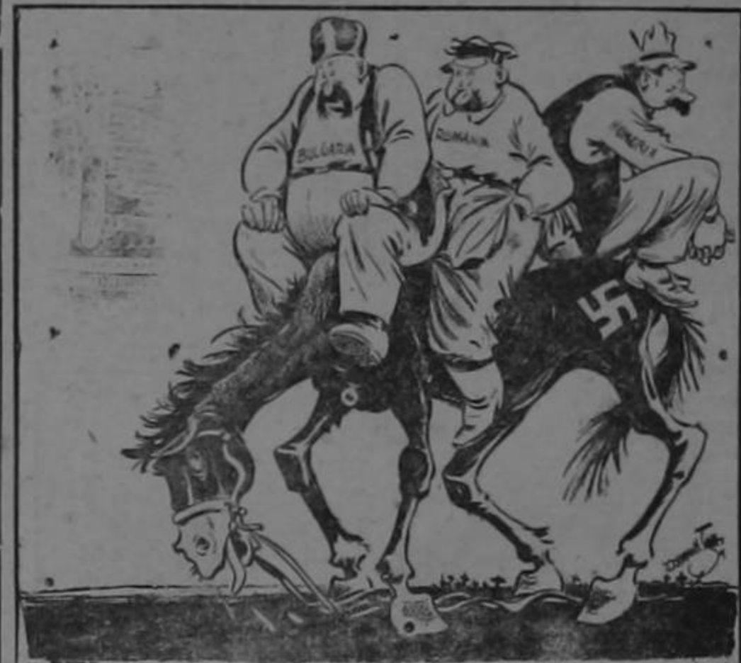
LOS TRES MOSQUETEROS