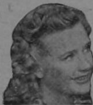
Priscilla Lane de la Warner Bros

DE VENTA EN TODAS LAS BOTICAS Y DROGUERIAS