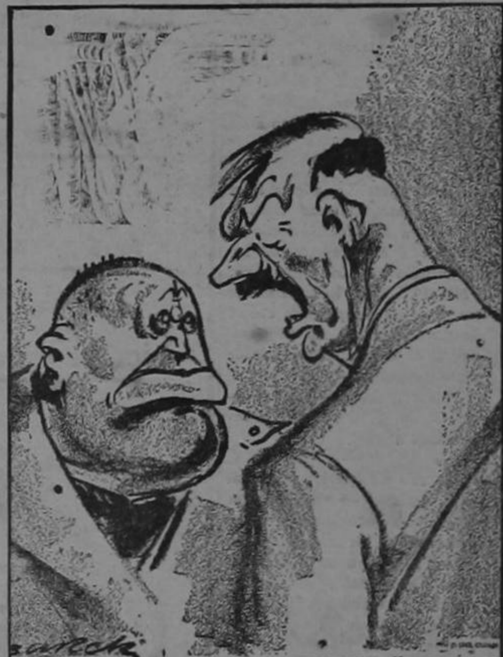
"...y haz el favor de no mencionarme nunca más los planes para la post-guerra, me oyes?"

Bien dicen que agua pasada ya jamás muele el molino, y esa mujer confiada perdió su ajuar y su chino