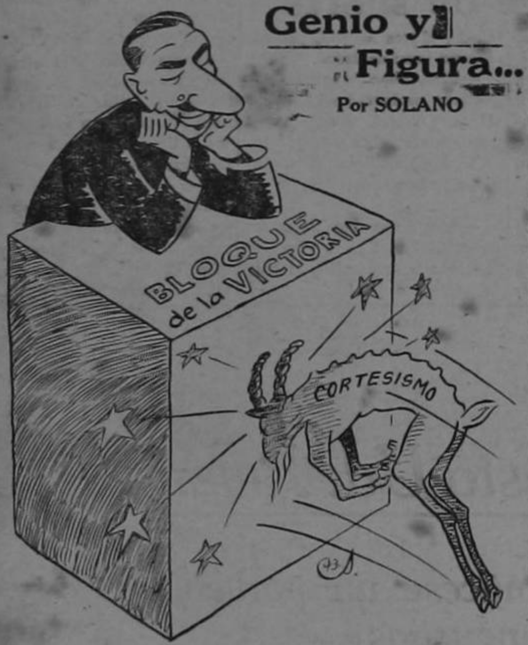
Genio y Figura... Por SOLANO

En el mes de Enero comenzará la repela de los 10.000 soldados que Costa Rica enviará a la guerra